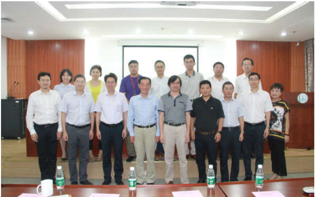
公共卫生学院第二届教授委员会成立