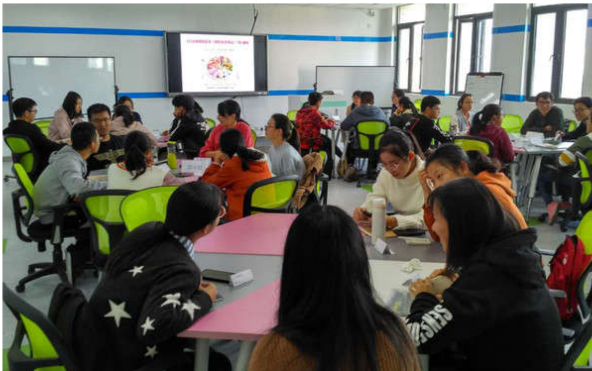
全新形式的《预防医学导论》正式开课