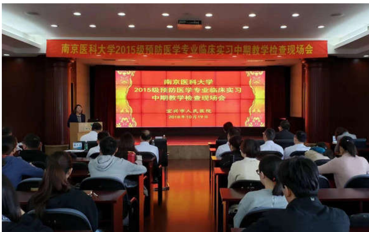
我院开展预防医学专业临床教学巡点调研工作