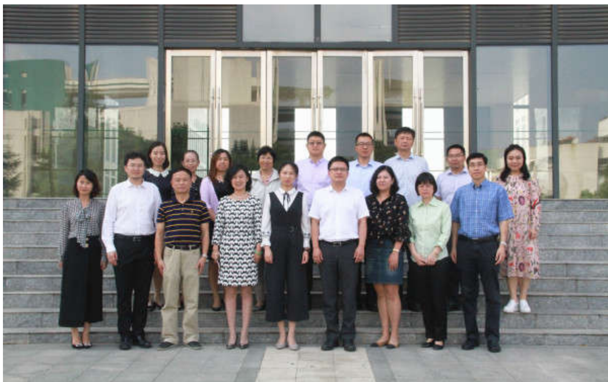
我校与迪安诊断技术集团股份有限公司签署“大学生创新创业实践基地”合作协议